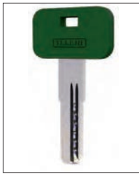
Chiave padronale Owner's Key