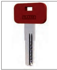
Chiave da cantiere Construction Key

Completo di: 1 chiave da cantiere - 5 chiavi padronali - 1 vite di fissaggio M5x70 1 scheda per la duplicazione Complet avec: 5 clés - 1 vis - carte de propriété - clé de chantier Provided with: 1 construction key - 5 owner's keys - 1 screw M5x70 - 1 card Completo de: 5 llaves - 1 tornillo - targeta de propiedad - llave de obra